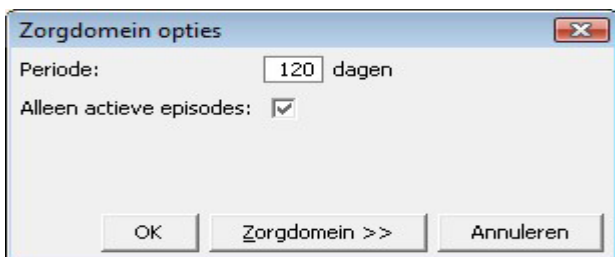
Figuur 1: instellen periode en episodes om mee te nemen naar ZorgDomein

Naast de periode kunt u ervoor kiezen om alléén actieve episodes (vinkje zetten) of actieve én inactieve episodes (geen vinkje) mee te nemen naar ZorgDomein, zie figuur 1.